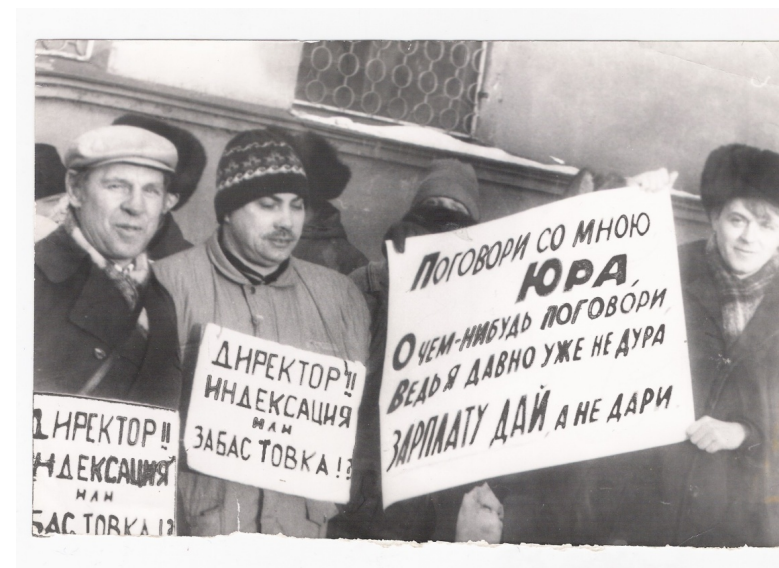
Фото: Рабочие свободного профсоюза ЧерМК на пикете 1994 г.

В конце концов, радикализовавшаяся в результате действий лагеря экологическая комиссия горсовета Череповца приняла решение в духе требований лагеря — обязать администрацию ЧерМК к 1-му декабря 1993 г. принять Технико-Экономическое обоснование — ТЭО реконструкции ЧерМК, прошедшее экологическую экспертизу. Это ТЭО предусматривает перенос наиболее