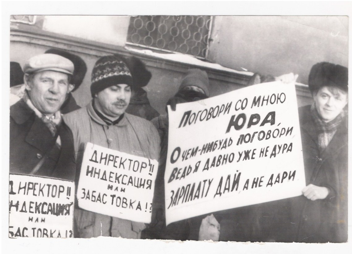
Фото: Рабочие свободного профсоюза ЧерМК на пикете 1994 г.