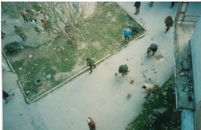
Протестующие разбирают брусчатку, Влёра, Албания, 1997 г.

прибегающие к ней, быстро оказываются в изоляции. Официальные лидеры, облачённые в свой многолетний опыт, беспощадно отрешиваются от этих „авантюристов и анархистов“». Как объясняет Фанон на примере Алжира и антиколониальной борьбы в целом: «Механизм партии сам по себе противостоит любым новшествам», а лидеры «испуганы и встревожены мыслью, что их может смести вихрь, природу, силу и направление которого они даже не могут представить». 30 Хотя эти оппозиционные политические лидеры в Албании, Алжире и т. д. обычно не определяют себя как пацифисты, интересно отметить, что они играют схожую роль. Истинные пацифисты более склонны принять обманчивую оливковую ветвь от умиротворяющих политиков, чем предложение солидарности от воору-