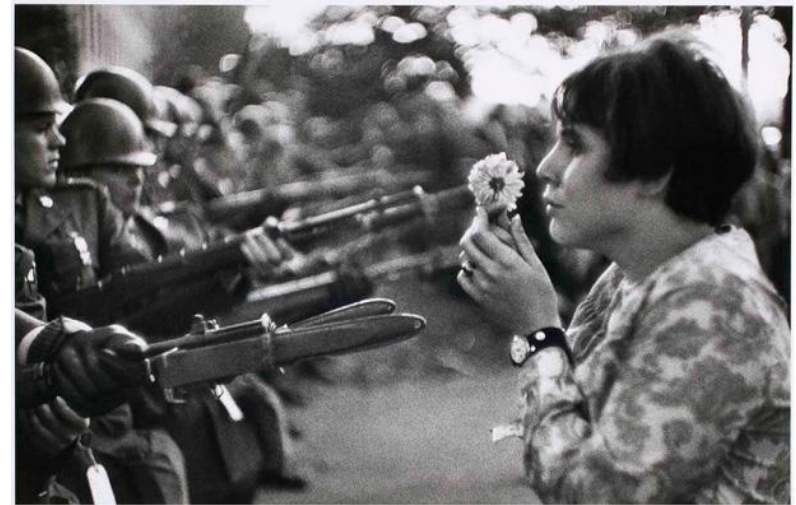
Антивоенная демонстрация, США, 1967 г.

правительства США вывести наземные войска из Вьетнама. Как заявил полковник Роберт Д. Хейнль в июне 1971 г.: