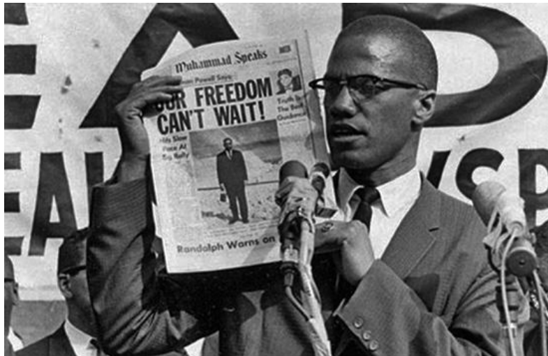
Малькольм Икс осудил марш, назвав его «фарс на Вашингтон».

точно не во главе всего этого“. Они говорили: „Эти негры действуют сами по себе. Они забегают впереди нас“. И старый хитрый лис ответил: „Если вы тут ни при чём, я вас выдвину. Я поставлю вас во главе этого. Я это согласую. Я буду это приветствовать...“.