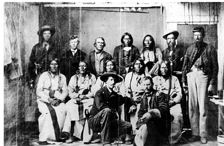
Шайенны и солдаты армии США после заключения мирного договора. Через два месяца армия США напала на поселение индейцев Сэнд-Крик, убив 150 человек, в основном женщин и детей.

народ сочувствует движению сопротивления, то правительственные репрессии столкнутся с большим сопротивлением. Убийство мирной группы Шайеннов и Арапахо в Сэнд-Крик только вызвало аплодисменты со стороны белых граждан; такой же была и реакция народа на репрессии против безобидных «коммунистов» в 1950-е гг. Но попытки британцев репрессировать «Ирландскую республиканскую армию» (IRA) в периоды их наивысшей популярности приводили лишь к большей поддержке IRA и большому стыду британцев — как в Ирландии, так и по всему миру. В последнее десятилетие попытки сербов раздавить «Армию освобождения Косово» приводили к тому же эффекту.