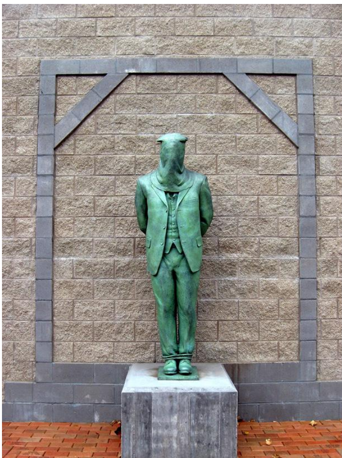
Мемориал «Молли Магвайрс», штат Пенсильвания, США.

аресты активистов, одетых в маски или отказывающихся от обыска. Участники марша договорились действовать ненасильственно, поскольку в марше участвовало много таких людей, как иммигранты и цветные, за которых организаторы марша проявляли нарочитое беспокойство по причине их большей уязвимости перед полицией. Но когда активисты — мирно — окружали сотрудников полиции, пытаясь не допустить происходящих задержаний, от них требовали двигаться дальше, игнорируя аресты участников марша, причём «миротворцы» и полиция кричали толпе одинаковые сообщения («Двигайтесь дальше!», «Следуйте по маршруту!»). Естественно, все попытки примирения и деэскалации провалились: полиция проявила столько насилия, сколько хотела.