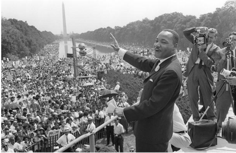
Мартин Лютер Кинг на «Марше на Вашингтон».

таким „мессией“; на сегодняшний день он является мучеником движения». 10 Тот факт, что Малькольм Икс был выделен ФБР как главная угроза, ставит вопрос о возможности участия государства в его убийстве; 11 бесспорно, что других чёрных активистов из непацифистской среды, определённых ФБР как «особенно эффективные организаторы», планировали устранить способами, включавшими в себя убийство. 12 В то же время Мартину Лютеру Кингу дозволялись признание и влияние до тех пор, пока он не