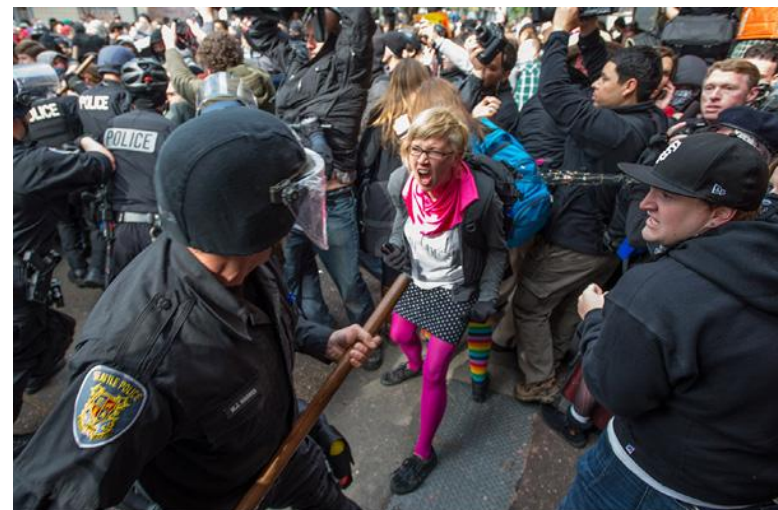
«Оккупай Сиэтл», 1 мая 2012 г.

паганизирующим эксплуатирующие и насильственные отношения, и нанесением ударов по наиболее вопиющим и, видимо, неисправимым примерам патриархата, — это единственный путь к тому, чтобы показать другим возможность альтернативы. Большинство работы, необходимой для преодоления патриархата, вероятно, будет мирной, сосредоточенной на исцелении общества и построении новой модели взаимоотношений. Но пацифистская практика, воспреещающая использование любых других тактик, лишает выхода тех, кому нужно защищаться от насилия уже сейчас.