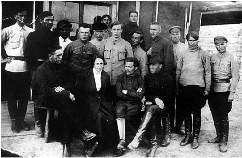
Группа махновцев в Познанщине (Польша), 1922 г.

насильственна, чем Куба Батисты. Однако у Кастро и так достаточно аполитетов, что отбивает у меня охоту тратить свою энергию подобным образом.