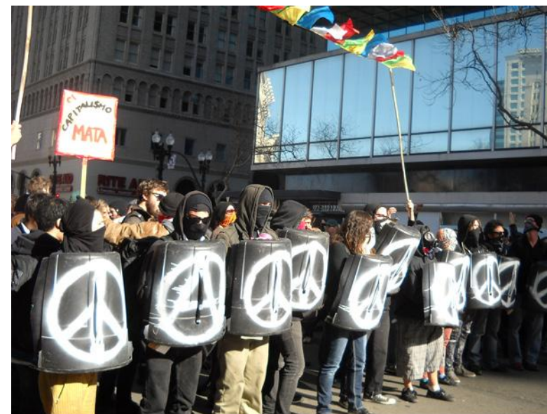
Демонстрация «Оккупай Окленд», США.

дарство милостивым, давая власти шанс потерпеть критику, на самом деле не представляющую угрозы продолжению её функционирования. Живописный, сознательный, пассивный протест перед военной базой только улучшает PR-имидж армии, ведь, конечно, только справедливая и гуманная армия будет терпеть акцию протеста перед своими воротами. Такой протест похож на цветок, засунутый в дуло винтовки. Он не лишает винтовку возможности стрелять.