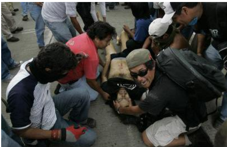
Протестующие пытаются спасти раненного из пистолета оператора. Позже он скончался в больнице, Мексика, 2006 г.

зиции. Тот же самый активист, который заявил, что наше общество уже настроено про-насильственно, попробовал бы упомянуть имя Леона Чолгоша (анархиста, убившего президента Маккинли) в разделе «Мнения» местной корпоративной газеты и увидеть, с каким осуждением широкая аудитория отнесётся к этому персонажу, олицетворяющему насилие. Причём тот же самый активист ссылается на таких пацифистов, как Кинг и Ганди, чтобы придать своим убеждениям ауру респектабельности в глазах широкой публики. 12 Если всё общество поголовно уже полюбило насилие, а пацифизм достаточно революционен, чтобы бросить серьёзный вызов нашему обществу с укоренившимся в нём угнетением, то почему Чолгош вызывает ненависть, а Ганди вызывает одобрение?