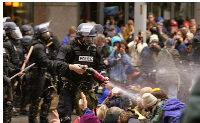
Нападение полиции на мирных протестующих, Сиэтл, 1999 г.

в Майами были совершенно незаслуженными даже по легилистическим критериям. 28 Одностороннее насилие не придало ни сил, ни достоинства протестующим — они подверглись после задержания жестокому насилию, и многих это отвратило от дальнейшего участия, включая активисток, подвергавшихся сексуальному насилию со стороны полицейских. В ещё более пассивных протестах в Вашингтоне — например, на ежегодных демонстрациях против