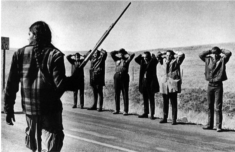
«Движение американских индейцев», события в Вундед-Ни, 1972-74 гг.

и невежеством. Возможность людей столкнуться с необходимостью насильственного отпора для выживания (не учитывая ситуацию применения обычной самообороны) или улучшения своих жизней во многом зависит от цвета их кожи и их места в различных локальных и глобальных иерархиях угнетения. Именно это ненасилие игнорирует, относясь к насилию как к чисто моральной дилемме или к личному выбору.