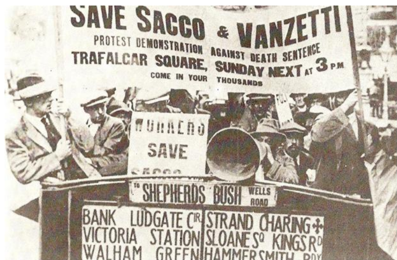
Акция в поддержку Сакко и Ванцетти.

на «передовой линии антифашистской борьбы» во всех итальянских кварталах на территории США 39 ), а также превратили кампанию по поддержке Сакко и Ванцетти в прецедент, привлёкший внимание всего мира.