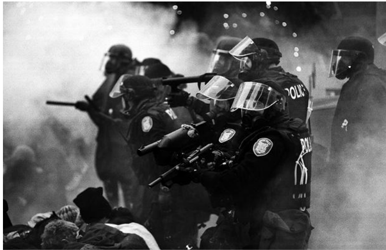
Вооружённые полицейские разгоняют демонстрацию, Сиэтл, 1999 г.

Мирового банка — ненасильственное сопротивление, состоящее из периодических срежиссированных задержаний, арестов, заключений под стражу и освобождений, не столько вдохновляло, сколько утомляло, и в итоге численность протестующих явно сокращается. Этим протестам, безусловно, не удалось привлечь внимание прессы или повлиять на людей своим спектаклем «страданий с достоинством», но сами пацифисты-организаторы в каждом случае объявляли критерием успеха численность участников, отсутствие столкновений с властями и насилия в отношении собственности.