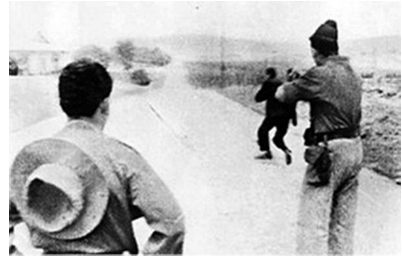
Французский солдат стреляет в мирного алжирца на глазах у журналистов.

сдастся только тогда, когда столкнётся с ещё большим насилием». 12