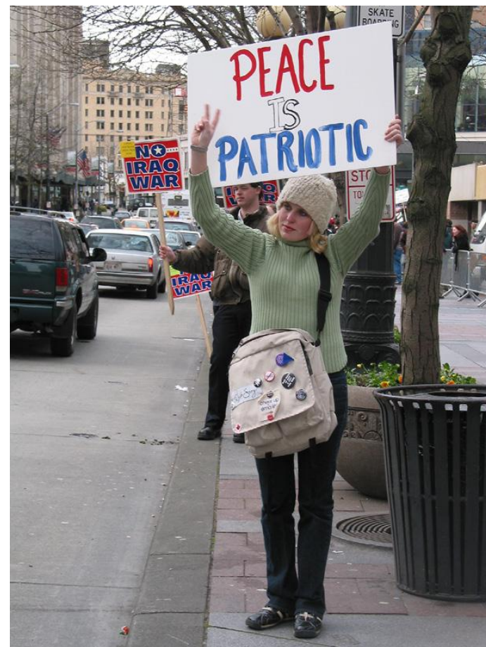
Акция против войны в Ираке.

Рассмотрим, например, деятельность «Организации надзора за Школой Америк» (SOA Watch). Более дюжины лет организация использовала ежегодные пассивные протесты, документальные фильмы и просветительские программы для накопления лоббистского ресурса, чтобы уговорить политиков поддержать закон о закрытии «Школы