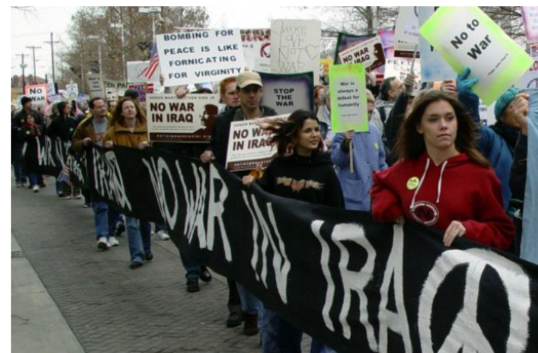
Демонстрация против войны в Ираке, США.

дами, крайне авторитарными, патриархальными и фундаменталистскими. И, без сомнения, лёгкость принятия ими решения о том, чтобы убить и искалечить сотни безоружных людей, каким бы стратегически необходимым это действие ни казалось, связано с их авторитарностью и жестокостью, а больше всего с культурой интеллектуализма, в которой воспитаны большинство террористов (хотя это уже совсем другая тема).