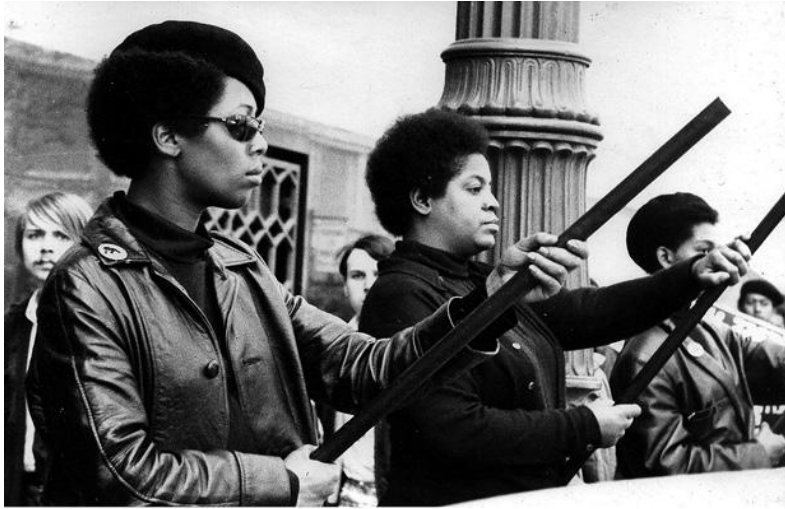
«Чёрные пантеры» во время демонстрации, США, 1969 г.

дняшнего патриархального общества. Патриархат не может быть уничтожен моментально, но группы, работающие над его искоренением, могут его постепенно преодолеть. Активисты должны признавать патриархат первостепенным врагом и открывать в революционных движениях места для женщин, квиоров и трансгендеров, чтобы те выступали творческой силой в направлении, оценке и реформировании борьбы (одновременно поддерживая усилия мужчин по анализу попыток встраивания нас в систему угнетения и по противодействию этим попыткам). Честный взгляд показывает, что, вне зависимости от наших целей, предстоит ещё много работы, чтобы освободить движение от контроля со стороны мужчин и найти здоровые, восстанавливающие мир пути преодоления оскорбительных моделей поведения как в социальных, так и в