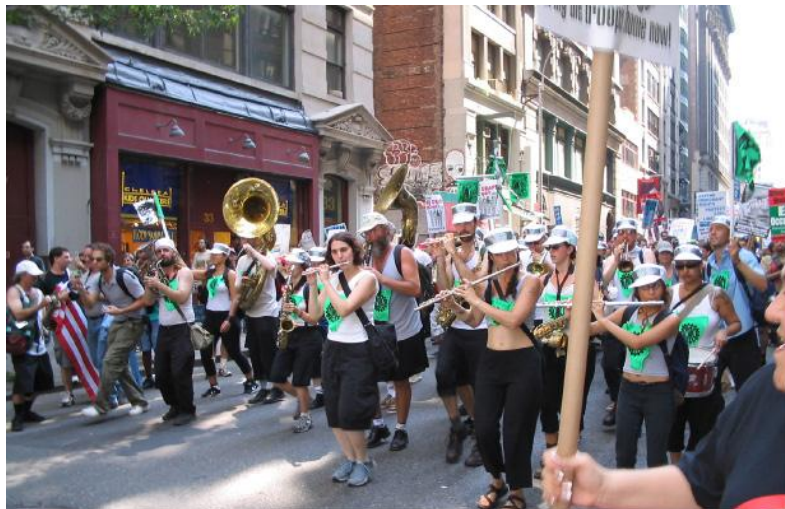
Протесты во время съезда «Республиканской партии», Нью-Йорк, 2004 г.

— улучшит имидж Буша (хотя на самом деле, беспорядки, хотя и не помогли бы «Партии демократов», но омрачили бы образ Буша как лидера и «объединителя»). Брошюра также предупреждала, что любой, отстаивающий агрессивные тактики, скорее всего — агент полиции. Марш закончился, и люди рассеялись в самом изолированном и наименее конфронтационном из всех возможных мест в городе, наполненном зданиями, представляющими государство и капитал, — на «Большом лугу» Центрального парка (другие протестующие, что симптоматично, сбились на «Овечьем лугу»). Танцы и праздник длились до глубокой ночи, сопровождаясь такими просветлёнными мантрами, как «Мы прекрасны!».