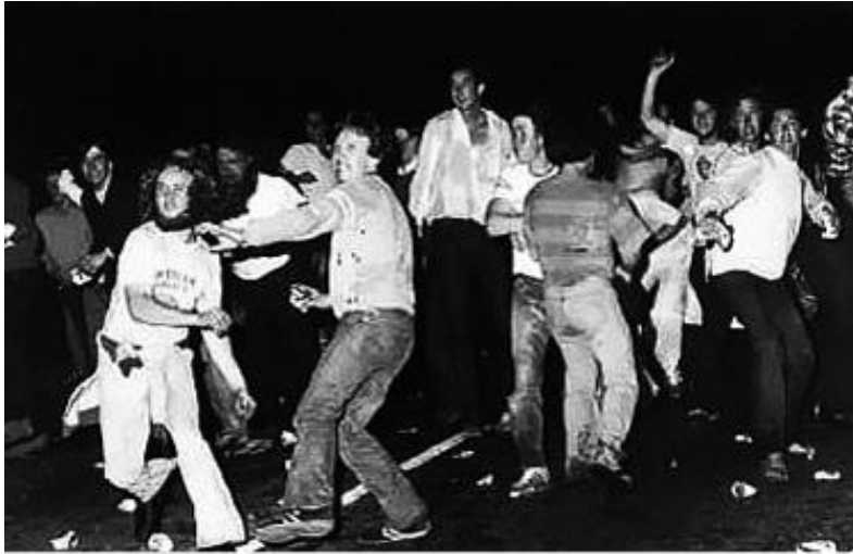
Протесты во время Стоунволлского восстания, США, 1969 г.

фабрикой и ответственной за производство загрязняющих веществ? Является ли самообороной убийство генерала, посылающего солдат насилловать женщин в зоне военных действий? Или пацифисты должны играть в защите, сопротивляясь лишь индивидуальным нападениям и покоряясь неизбежности вышеописанного насилия, ожидая до тех пор, пока ненасильственные тактики внезапно не убедят генерала или закроют фабрику — когда-нибудь в будущем?