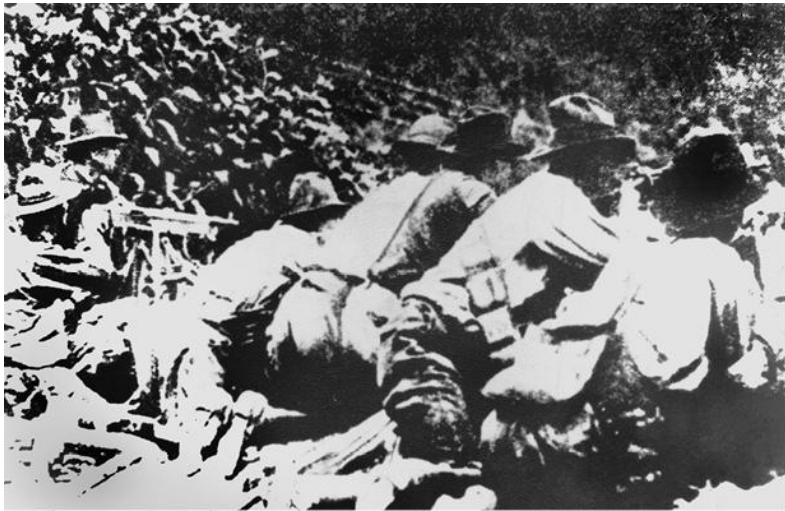
Битва у горы Блэр.

распространение профсоюза на все шахты (их профсоюз существует и по сей день). 41