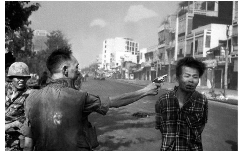
Убийство пленного вьетконговца, Южный Вьетнам, 1968 г.

шее лидеров американской политики понять, что победа невозможна; и воинствующее, зачастую смертоносное, сопротивление самих наземных войск США, порождённое деморализацией — результатом как эффективного насилия со стороны врага, так и привнесения в армию воинствующего политического протеста из чёрного освободительного движения того времени. Внутреннее антивоенное