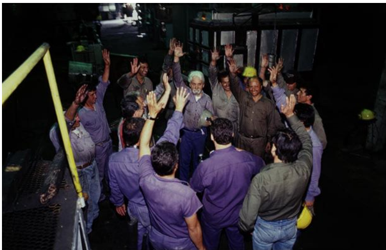
Ассамблея на заводе Форха, Аргентина, 2004 г.

сочтут наилучшей для достижения их нужд, при этом любой участник сообщества мог бы легко присоединиться к свободным ассоциациям взаимопомощи 6 или покинуть их. Каждый обладает врождённым потенциалом свободы и самоорганизации, поэтому, если мы определяем себя как анархистов, наша задача не в том, чтобы обратить всех остальных в анархизм, а в том, чтобы использовать наш кругозор и коллективный опыт для защиты от поглощения нас системными левыми, а также предоставлять модели автономных социальных отношений и самоорганизации культурам, где их сейчас нет.