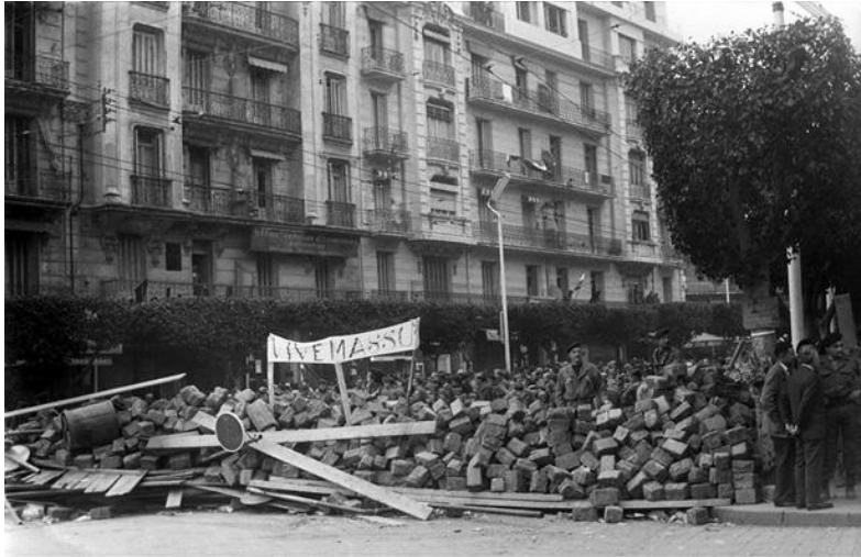
Баррикады во время «Алжирской войны за независимость», Алжир, 1960 г.

они наслаждались почти десятилетием относительного мира и автономии, пока Кастер не вторгся на территорию Чёрных холмов в поисках золота. 20 Но вместо того, чтобы приспособлять средства (наши тактики) к ситуации, в которой мы находимся, нам предлагают принимать решения, основываясь на условиях, которых вообще нет, действуя так, как будто революция уже произошла и мы живём в новом лучшем мире. 21 Этот полный отказ от стратегии игнорирует даже то, что ни один из двух прославленных лидеров ненасилия (Ганди и Кинг) не верил в то, что пацифизм является универсально применимой