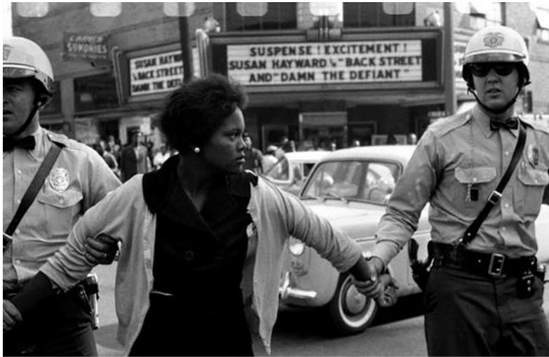
Бирмингем, штат Алабама, 1963 г.

уверенностью в своей праведности мирные активисты игнорируют тот факт, что от 3 до 5 миллионов индокитайцев погибли в борьбе с армией США; что десятки тысяч американских военных были убиты, а сотни тысяч ранены; что остальные войска, деморализованные всей этой мясорубкой, стали крайне неэффективны и склонны к мятежу 20 ; и что США теряли политический капитал (и двигались к финансовому банкротству) с такой скоростью, что даже провоенные политики стали призывать к стратегическому отступлению (особенно после того, как Тетское наступление показало, как многие тогда выражались, «без-