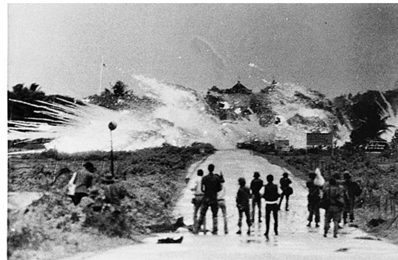
Бомба из смеси напалма и белого фосфора, сброшенная южновьетнамскими ВВС, взорвалась на шоссе у деревни Чангбанг, Вьетнам, 1972 г.