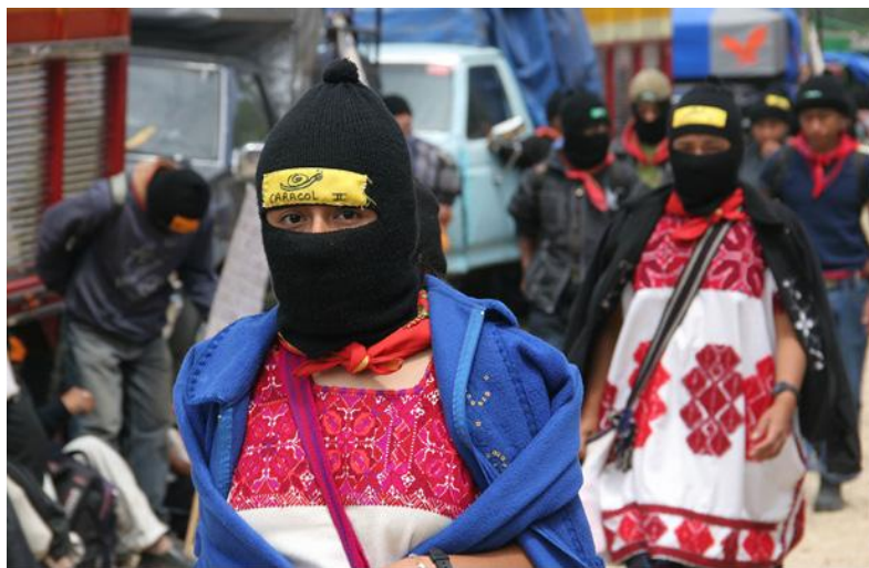
Сапатисты на «Марше за мир», Мексика, 2011 г.

сделать акцент на создании автономной культуры, способной сопротивляться контролю сознания со стороны СМИ, а также на создании социальных центров, бесплатных школ и больниц, земледельческих общин и других структур, способных поддерживать сообщества, участвующие в сопротивлении. Вестернизованным народам также нужно развивать коллективные социальные отношения. Люди из развитых стран, даже будучи анархистами, не становятся исключением из правил, пропитываясь индивидуалистическими формами социальных взаимодействий, основанных на наказаниях и привилегиях. Нам нужно внедрить работоспособные модели восстановительного или трансформативного правосудия для того, чтобы полиция и тюрьмы действительно не были нужны. Пока мы зависим от государства, мы никогда его не свергнем.