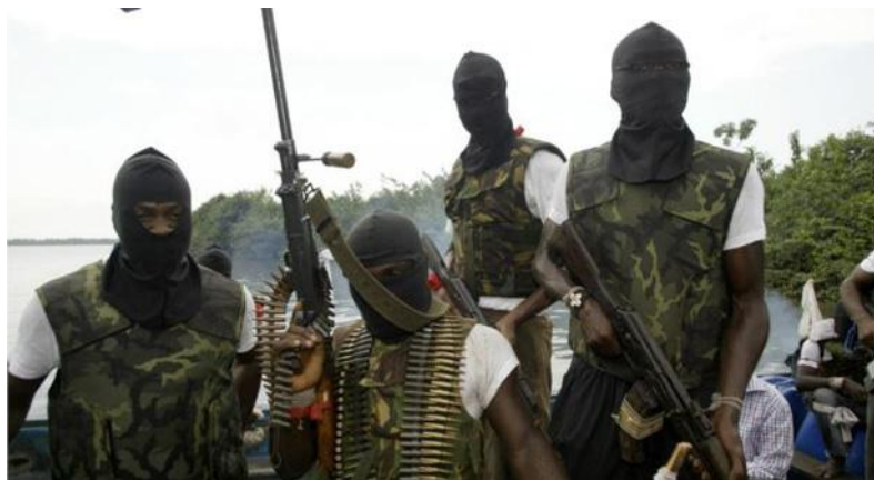
Повстанцы из «Движения за освобождение дельты Нигера».

это явно предотвратило бы «кризис» правительства и снова сбило цены на нефть, чего, полагаю, и нужно Северной Америке для спокойной жизни.