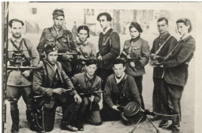
Партизанский отряд евреев, возглавляемый Аббой Ковнером, 1944 г.

закрыт. Восстание в Трешлинке в августе 1943 г. уничтожило этот лагерь смерти, и он не был отстроен. Участники другого выступления в Освенциме в октябре 1944 г. уничтожили один из крематориев. 44 Все эти ожесточённые схватки замедлили Холокост. С другой стороны, ненасильственные тактики (как и правительства Союзников, чьи бомбардировщики легко могли долететь до Освенцима и других лагерей) не сумели закрыть или уничтожить ни одного лагеря смерти до самого конца войны.