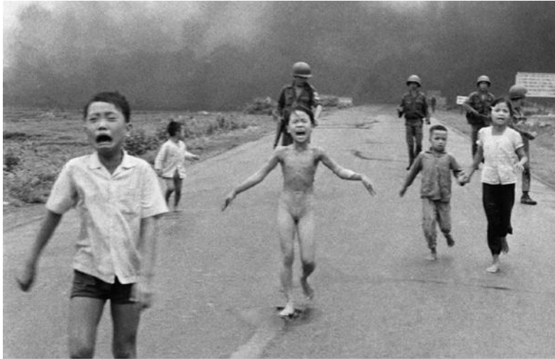
Дети бегут по шоссе после напалмовой атаки на их деревню.

Почти никогда между участниками не было полного согласия, и некоторые из действий, сочтённых насильственными, они также сочли нравственными, в то же время некоторые из участников сочли определённые ненасильственные действия аморальными. Вывод, явно следующий из этого упражнения: имеет ли реальный смысл настолько основывать нашу стратегию, наши союзы и наше участие в активизме на концепте, который настолько туманен, что даже два человека не могут сойтись на том, что он означает?