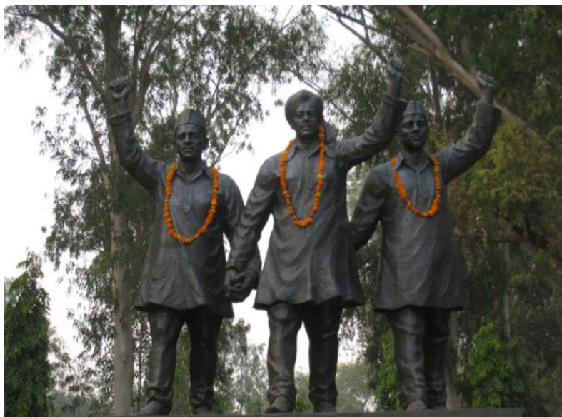
Статуи революционеров Бхагата Сингха, Шиварама Раджгуру и Сухдева Тапара на индийско-пакистанской границе, около Хусаинивала.

забастовку, когда нацисты и местные власти готовились их депортировать. 36 Этот акт гражданского неповиновения, возможно, ненадолго задержал депортацию, но не спас ни одной жизни.