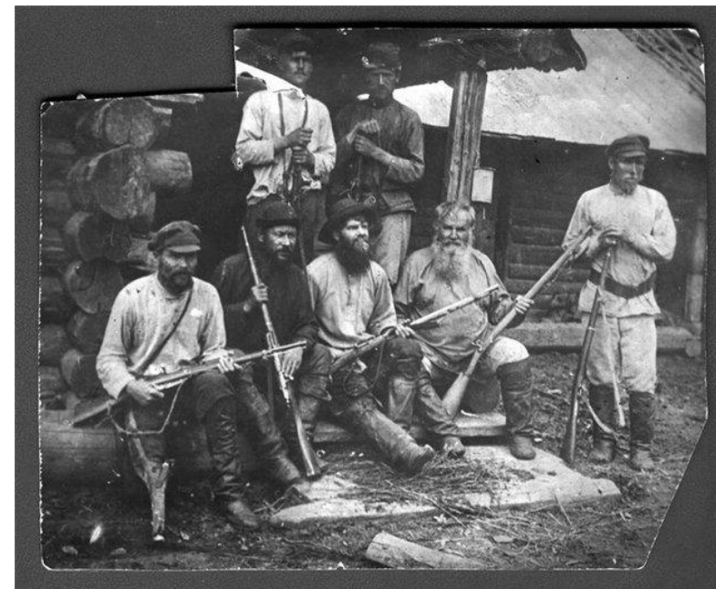
Партизаны армии Кравченко - Щетинкина

сти 18 . Партизаны находились в Тыве до сентября 1919 г., когда развернули наступление на Минусинск. За это время в их армию вступило до 500 русских и тувинцев 19 , в том числе и некоторые из будущих активистов аратского движения.