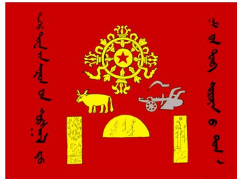
Знамя ЦК ТНРП(Хранится в Национальном музее РТ)