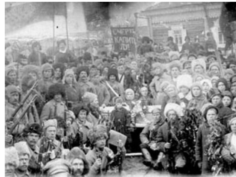
Анархистский партизанский отряд в Сибири

в городе Грайцера и еще нескольких человек арестовали и под конвоем отправили в Черемхово 3 .