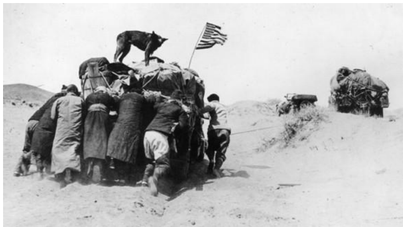
Экспедиция Эндрюса в Монголии